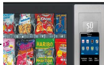
MAXXvend 5.0 für Verpflegungs-automaten