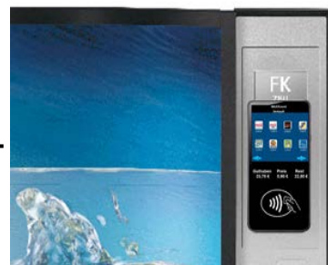
MAXXvend 5.0 für Kaltgetränke-automaten