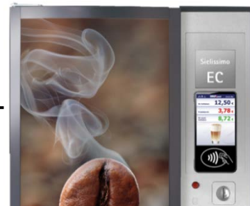
MAXXvend 5.0 für Heißgetränke-automaten